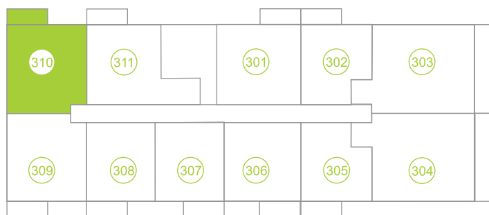
Půdorys podlaží / Floor plan